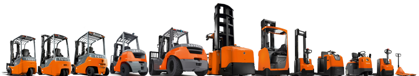
Řada čelních vysokozdvížných vozíků, skladových vozíků a tahačů Toyota.