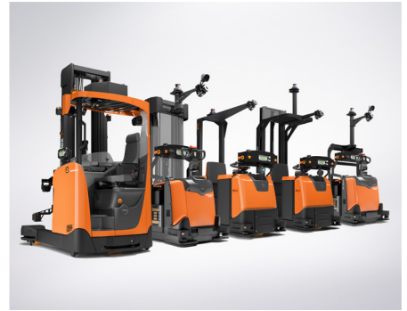
Řada automatizovaných skladových vozíků Toyota