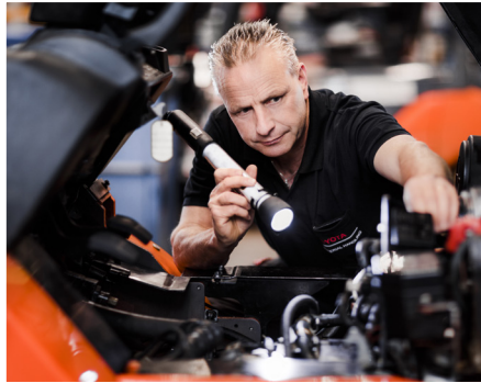
Servisní koncept Toyota