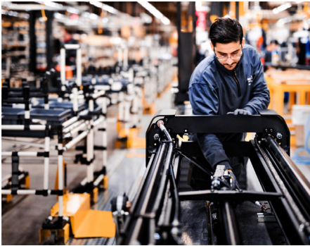
Výrobní systém Toyota TPS

Toyota Material Handling Europe (TMHE) pomáhá společnostem všech velikostí napříč Evropou naplňovat výzvy materiálové manipulace dneška. Společnost nabízí kompletní řadu čelních vysokozdvížných vozíků a skladové techniky Toyota, spolu se souvisejícími službami a řešeními. Společnost zahájila svoji činnost v roce 2006 sloučením evropských podniků Toyota a BT. Toyota zajišťuje také výrobu a distribuci vysokozdvížných vozíků Cesab. Ve fiskálním roce 2020 (1) zaznamenala Toyota prodeje 104 000 strojů a celkové čisté tržby ve výši 2,5 miliardy Eur.